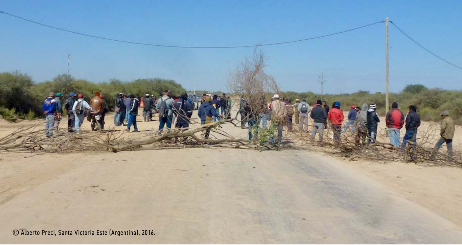
© Alberto Preci, Santa Victoria Este (Argentina), 2016.