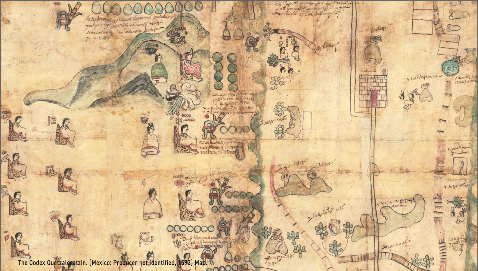
The Codex Quetzalcatzin. [Mexico: Producer not identified, 1593] Map.