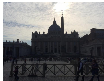
La place Saint-Pierre