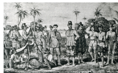
Bosquejos de la Guerra del Paraguay, con ilustraciones de Adolfo Methfessel, Buenos Aires, Ed. Hermann Tjarks y Co, 1904.