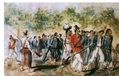
José Ignacio Garmendia, « Colonne de prisonniers alliés », aquarelle, Musée Saavedra.